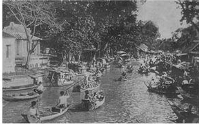
ตลาดปากน้ำ (ซ้าย) และคลองบางกอกน้อย (ขวา) ที่แสดงให้เห็นถึงการค้าขายที่เจริญรุ่งเรืองในอดีต