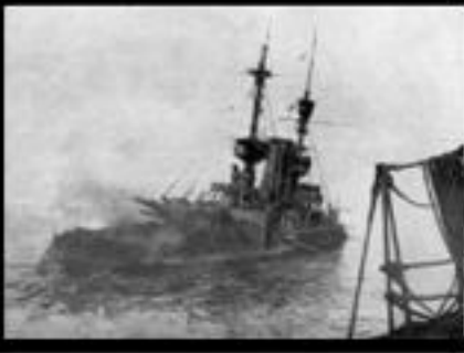
ภาพเหตุการณ์ในสมัยสงครามโลกครั้งที่ ๑ เป็นสงครามในแถบยุโรป