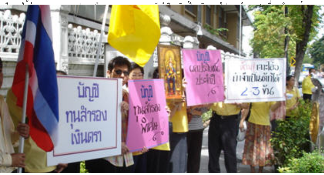
หรือนิติบุคคล

สำหรับสาระสำคัญของการแก้ไขกฎหมายเงินตราฉบับนี้ สรุปเฉพาะประเด็นที่เกี่ยวข้องกับคลังหลวง ดังนี้. เพิ่มประเภทของหลักทรัพย์ต่างประเทศที่จะประกอบขึ้นเป็นทุนสำรองเงินตรา และเพิ่มกรณีการออกกฎกระทรวงให้สามารถกำหนดหลักทรัพย์ที่ออกโดยองค์การหรือนิติบุคคลต่างประเทศอื่นได้ด้วย ผลกระทบ