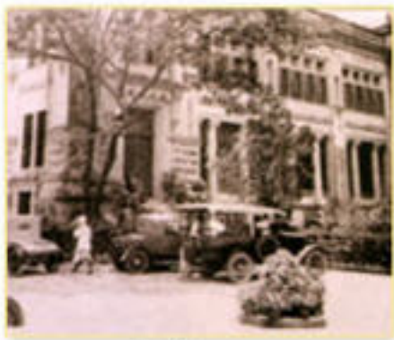
ตึกที่ทำการ บริษัทแบงก์สยามกัมมาจล จำกัด

ต่อมากิจการได้ขยายธุรกิจอย่างรวดเร็วจนปรับเปลี่ยนเป็นธนาคารพาณิชย์อย่างเป็นทางการในชื่อ &quot;บริษัทแบงก์สยามกัมมาจล จำกัด&quot; ได้เป็นผลสำเร็จเมื่อวันที่ ๓๐ มกราคม พ.ศ. ๒๔๔๙ ท่ามกลางการต่อต้านอย่างหนักจากธนาคารพาณิชย์ต่างประเทศ จากอังกฤษและฝรั่งเศสต่างจ้องจ้องและจับผิดไทยในเรื่องนี้มาก