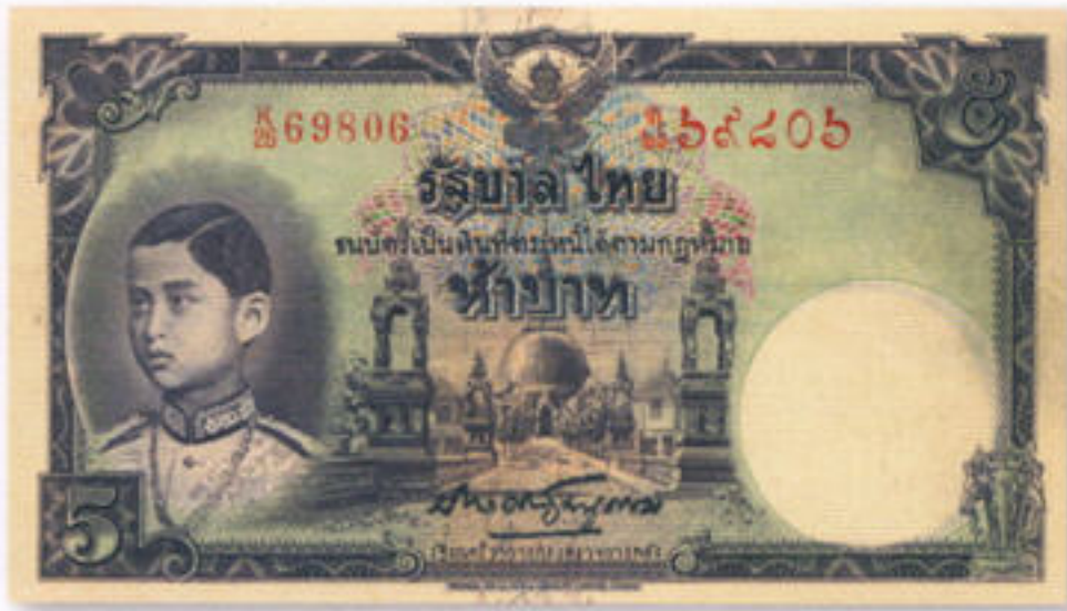
ตัวอย่าง ธาบัตรแบบ ๕ รุ่น ๒ ประกาศออกใช้ ๗ มีนาคม ๒๔๘๒

สำหรับแนวคิดในการจัดตั้ง &quot;ธนาคารกลาง&quot; ของพระเจ้าบรมวงศ์เธอ กรมหมื่นมหิศรราชหฤทัย ที่ถูกระงับไปก่อนเนื่องจากที่ปรึกษาการคลังชาวอังกฤษไม่เห็นด้วยและไม่ให้การสนับสนุน แต่ด้วยตระหนักถึงความยากลำบากของคนไทย